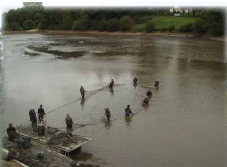
Pêche au filet

Après une pêche au filet, effectuée par la Fédération de Pêche, qui a permis de récupérer les carpes présentes qui ont été transférées au plan d'eau de Corlay, le plan d'eau a été complètement vidé par des pompes à débits importants installées sur le chantier.