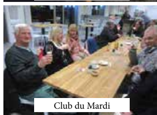
Club du Mardi