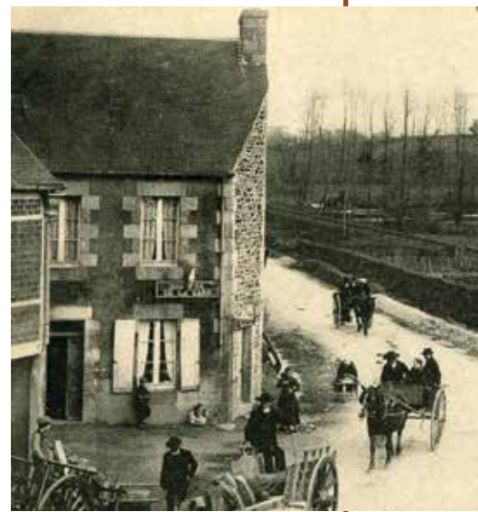
Vue de 1912

Pratique : Ouvert de 7h à 20h toute la semaine, sauf mardi et jeudi après-midi, le dimanche de 9h à 14h.