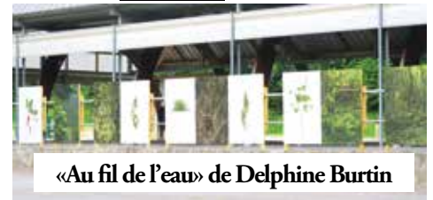
«Au fil de l'eau» de Delphine Burtin