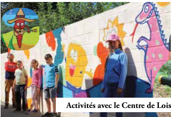
Activités avec le Centre de Loisirs