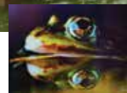
«Grenouille&C°» par Eaux & Rivières