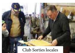
Club Sorties locales