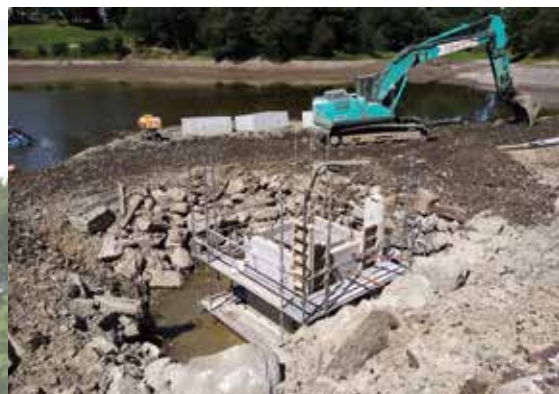
Montage du Moine