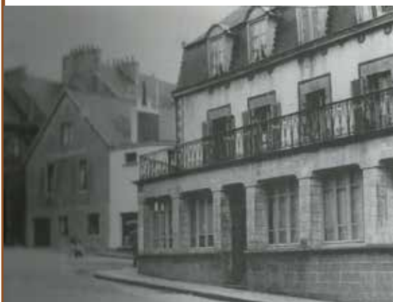
Le carrefour dans les années 1940, avant qu'il ne soit doté du seul feu tricolore de la ville.

Disposant de deux étages et d'une terrasse, La P'tite crêperie est ouverte toute l'année.