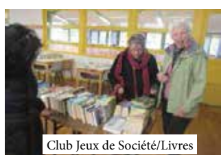
Club Jeux de Société/Livres

L'Association propose, pour une adhésion annuelle de 10€, de nombreux clubs pour permettre à tous de se rencontrer, quels que soient les goûts et les intérêts de chacun, et de se faire de nouveaux amis : le Tir à l'Arc est la seule activité pour laquelle une petite contribution supplémentaire est demandée les deux premières années.