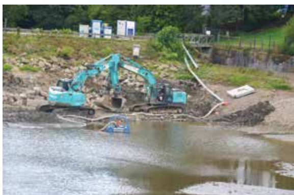
Démarrage des travaux