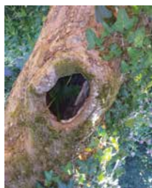
Les pommiers creux sont des bôtes aujourd'hui rares pour les chouettes comme la chevêche (an hoper bibañ) et devraient être préservés. La mésange nonette ne niche QUE dans les cavités naturelles.