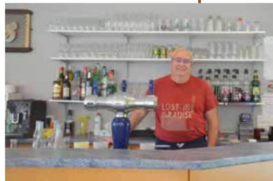
Le Patron derrière son bar

Pratique : Ouvert du lundi au vendredi midi de 12h à 14h.