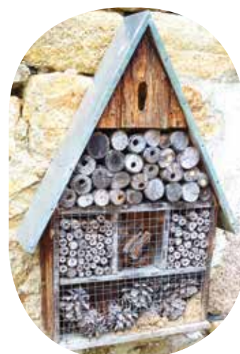
Hôtel à insectes - tiges creuses (ombellifères, sureau évidé...) - Guêpes maçonnes, syrphes et abeilles solitaires prédatrices d'autres insectes et pollinisatrices apprécient ces gîtes ensoleillés.

Tous ces éléments créent et favorisent la biodiversité si utile au Vivant.