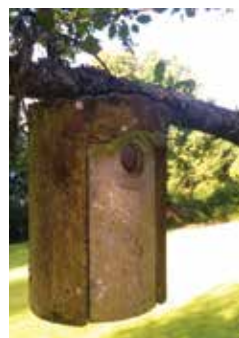
Nichoires Schwegler en béton de bois.

« Le gîte et le couvert » : ces deux éléments sont le facteur limitant de la présence d'une espèce animale. Sans lieu de reproduction (le gîte), pas d'espèce animale - «utile ou nuisible» et ces termes sont sujets à caution, nous le verrons ensuite. Sans source alimentaire (le couvert) -eau comprise- pas de maintien des individus : P'Homme excepté, toute espèce cesse de se reproduire si la nourriture manque !