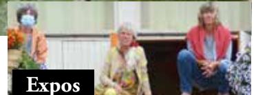
Expos de l'été