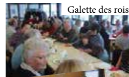
Galette des rois