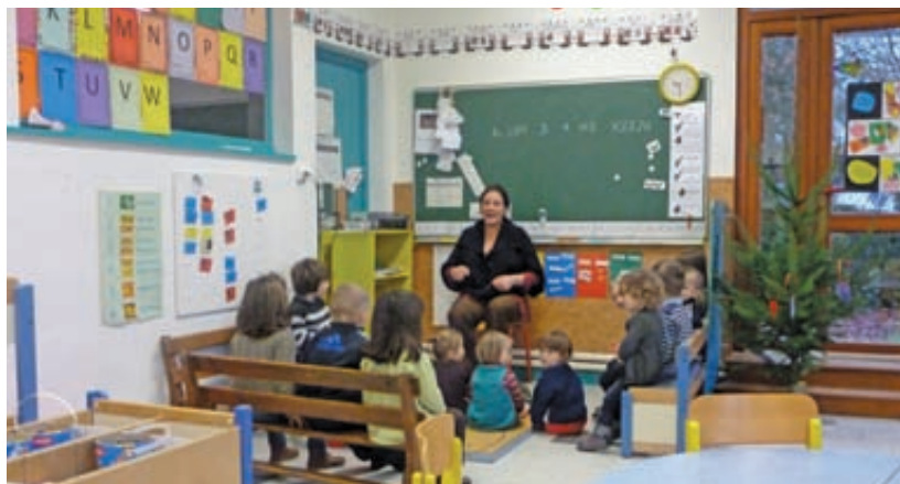
Les enfants prennent visiblement plaisir à parler breton.

Cet engagement est une prolongation au soutien déjà apporté par la commune aux associations locales telles que Strollad Kallag et Eostin Spered ar Yezh qui, par leur travail régulier depuis de nombreuses années, ont participé à la préservation de la langue bretonne.