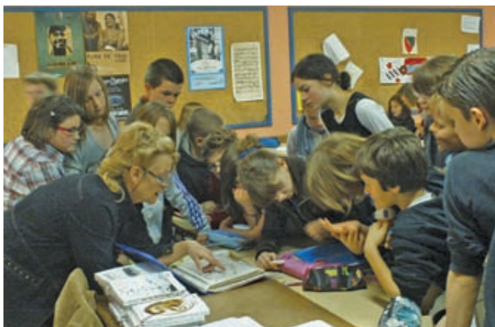
Le projet littéraire a intéressé les élèves du collège.

Eh oui ! 8 ans déjà au service de la culture pour Callac et le Centre Bretagne. Voici un petit panorama des actions et réalisations de cette association dynamique.