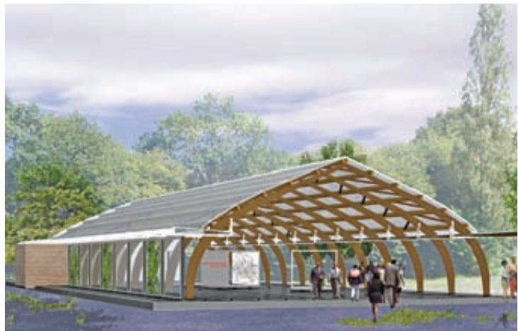
La nouvelle halle se caractérisera par son aspect aérien et transparent, tout en optimisant la protection vis à vis du vent et de la pluie.

En 2015, ce sera au tour du bâtiment associatif du plan d'eau d'être entièrement rénové.