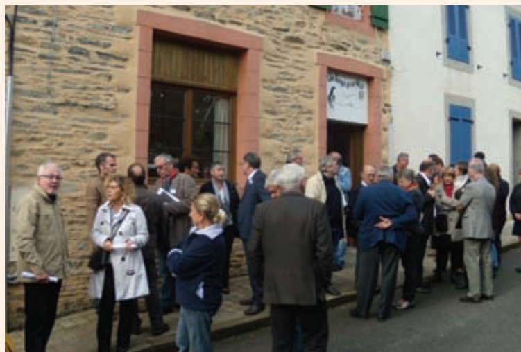
Le groupe d'élus en visite à Lopérec.

En attendant, la rénovation des façades et la mise hors d'eau préservent ce patrimoine bâti de la dégradation et donne au bourg une image plus attractive.