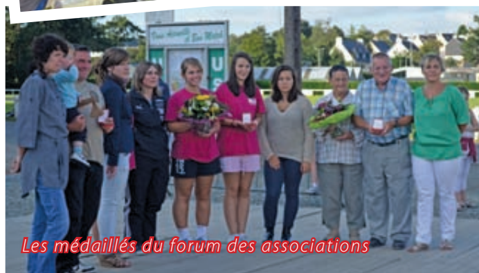
Les médaillés du forum des associations