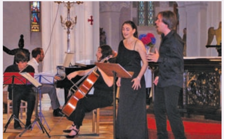
Concert classique dans l'église de Callac.