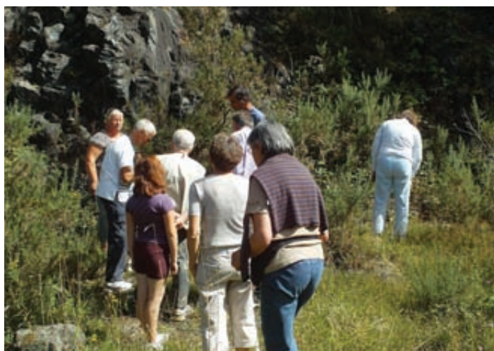
Sortie géologique à la carrière volcanique Milin ar Stang de Lohuec.