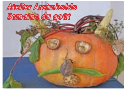
Atelier Arcimboldo Semaine du goût