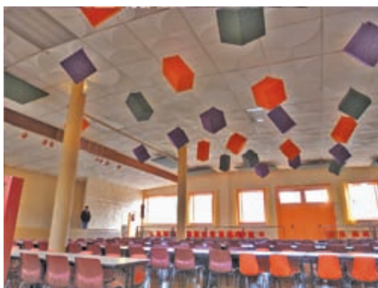
Le plafond de la salle des fêtes a été modifié pour améliorer l'acoustique du local.

Au mois de septembre, les services techniques de la ville ont donc commencé les travaux. Un parquet en bois de chêne a été posé, poncé et vitrifié. Dans le même temps, un équipement destiné à améliorer le confort acoustique de la salle a été installé. En effet, si les murs en béton réfléchissent très bien les ondes sonores depuis la scène, ils génèrent un phénomène de réverbération sonore à l'origine du brouhaha assourdissant qui gênait considérablement les conversations avec son voisin lors des repas ou des réunions importantes.