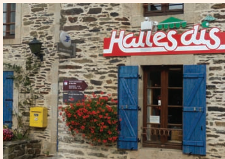
Un exemple de réhabilitation d'un ancien bâtiment devenu épicerie dans le centre du bourg.