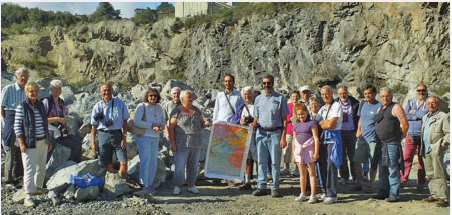
Sortie géologique dans la carrière de pierres Parcheminer à Calanhel.