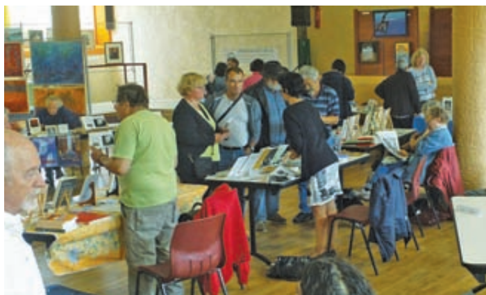
Le salon du livre a connu un beau succès.