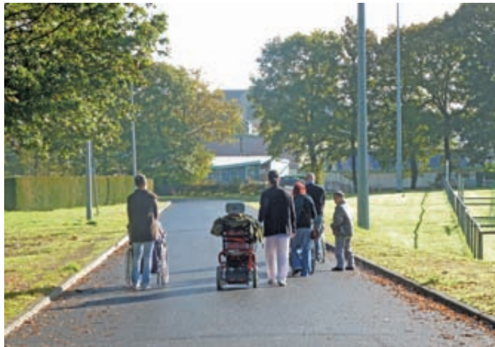
Le chemin d'accès à la Maison d'Accueil Spécialisée (MAS) a été enrobé pour faciliter l'accès des résidents au centre-ville.

La loi du 11 février 2005 impose aux collectivités la mise en accessibilité à tous les bâtiments publics pour toute personne en situation de handicap et ce, pour 2015. C'est pourquoi depuis 2 ans, le conseil municipal travaille sur ce sujet.