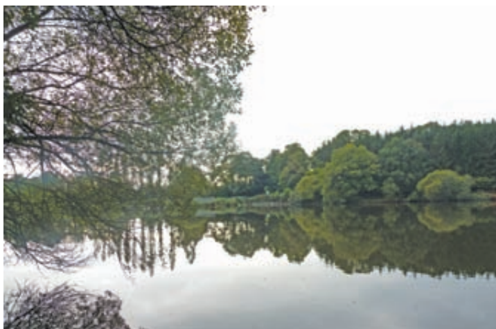
Le barrage de l'étang de la Verte Vallée a été construit en 1978 pour faire du site, une base de loisirs.

Pour se mettre en conformité avec la réglementation en vigueur, la commune de Callac a décidé le réaménagement du barrage de la Verte Vallée.