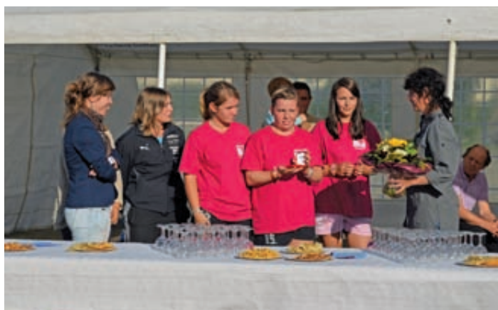
L'équipe de hand-ball de l'Amicale laïque.