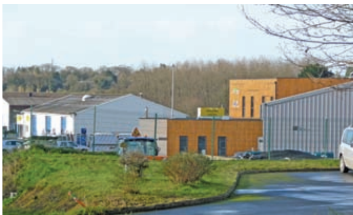
Une vue de la zone de Kerguiniou avec le bâtiment communautaire.

La municipalité de Callac s'engage fortement dans cette initiative.