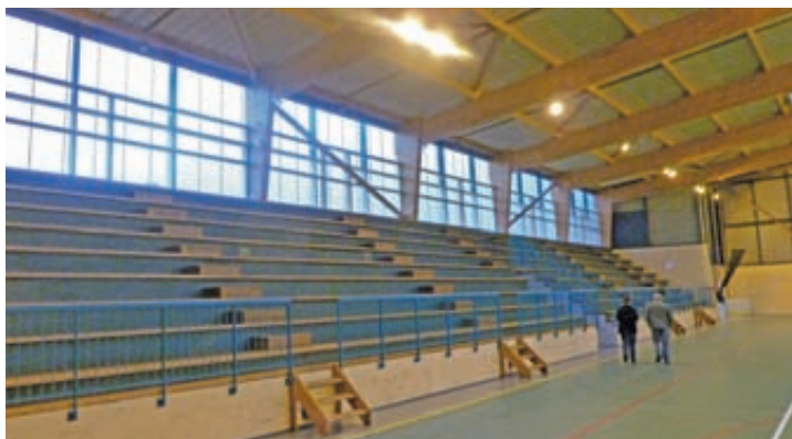
La salle Albert Montfort a réouvert ses portes aux sportifs et à leurs supporters enthousiastes.

L'équipe municipale continue la remise à niveau de tous les locaux communaux. L'intérieur de la salle des fêtes a changé de look et la salle de sports Albert Montfort a réouvert ses portes.