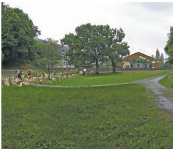
La nouvelle halle dans son environnement.

Le parcours des eaux pluviales, jusqu'alors souterrain, sera révélé par la création d'un fossé sur lequel quelques blocs de béton récupérés sur le site seront mis en place. Les plantes épuratrices pourront s'y développer.