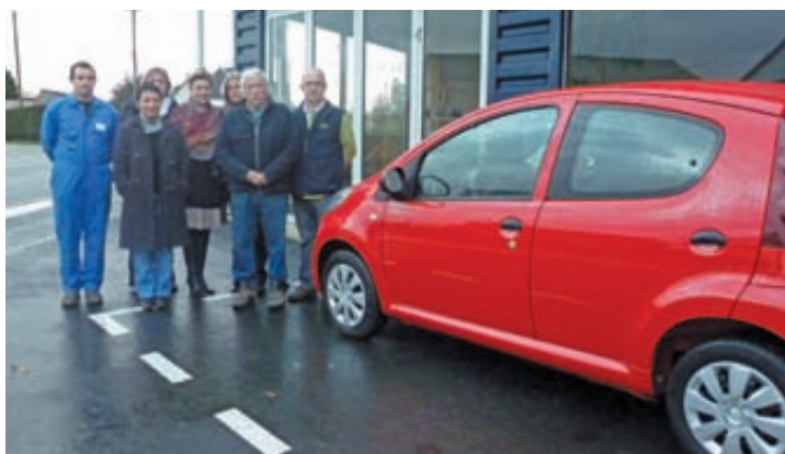
Une délégation du Comité des commerçants et artisans de Callac présente le gros lot de la foire d'hiver, une 107 Peugeot.

Chaque année, des milliers de clients viennent à Callac, attirés par les quinzaines commerciales de printemps et d'hiver.