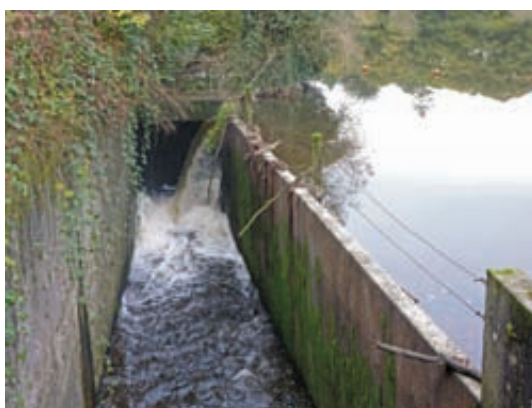
Tout ce qui peut gêner le passage de l'eau sur le déversoir va être supprimé.